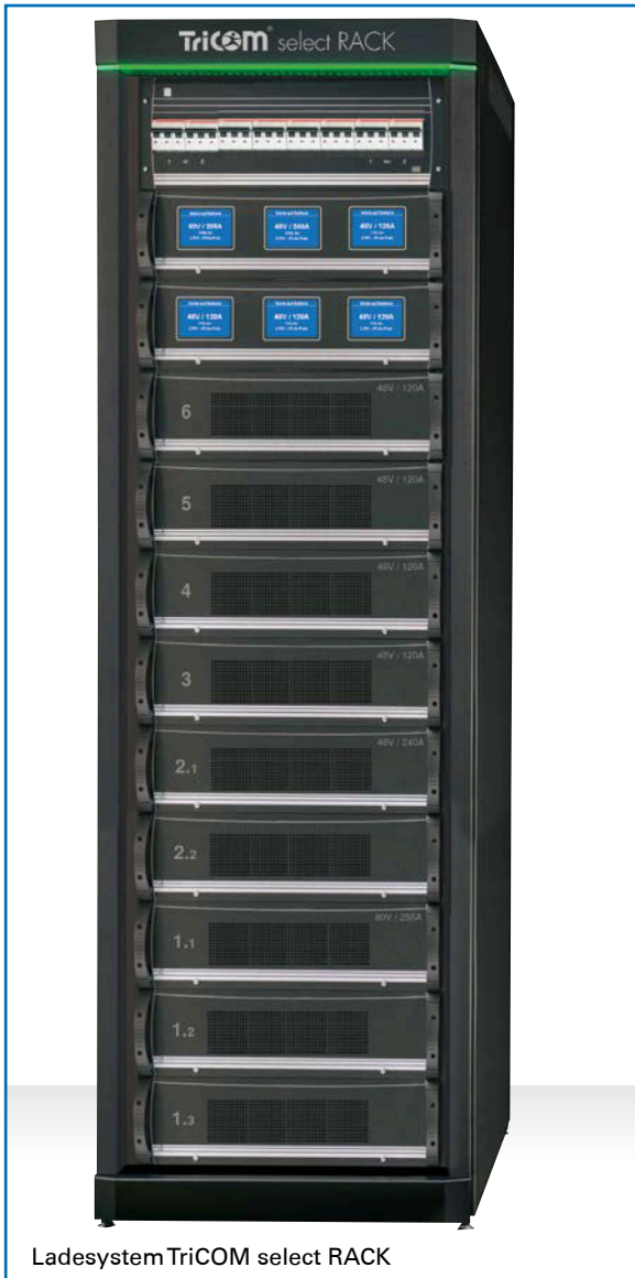
Ladesystem TriCOM select RACK