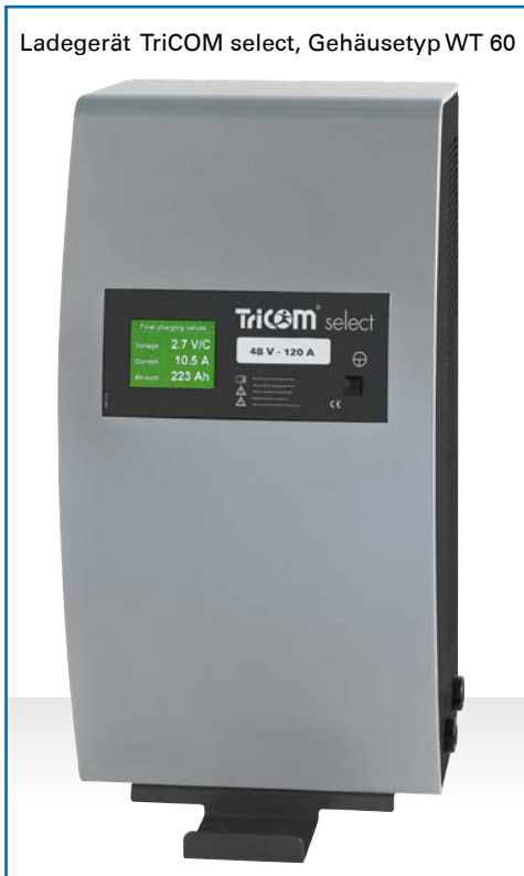
Ladegerät TriCOM select, Gehäusetyp WT 60