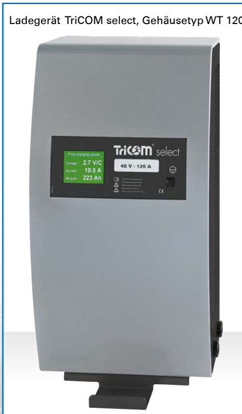
Ladegerät TriCOM select, Gehäusetyp WT 120