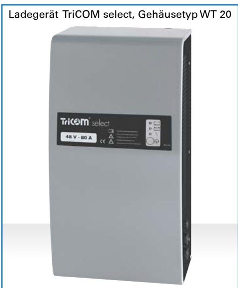
Ladegerät TriCOM select, Gehäusetyp WT 20