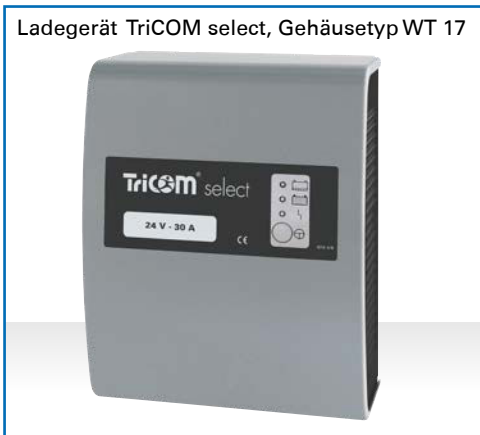
Ladegerät TriCOM select, Gehäusetyp WT 17